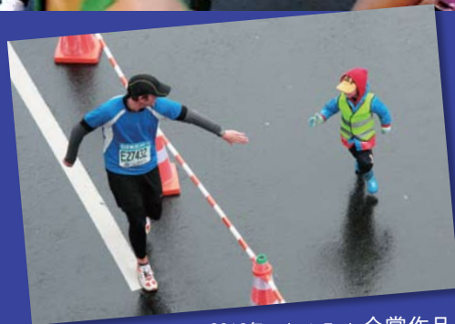
2010年フォトコンテスト 金賞作品

主催：財団法人 東京観光財団／共催：東京都／協力：社団法人 日本広告写真家協会(APA) 株式会社 アシックス ※ご注意：応募要項を必ずご覧になってからご応募ください。