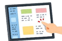
ホームページ等の 多言語化対応