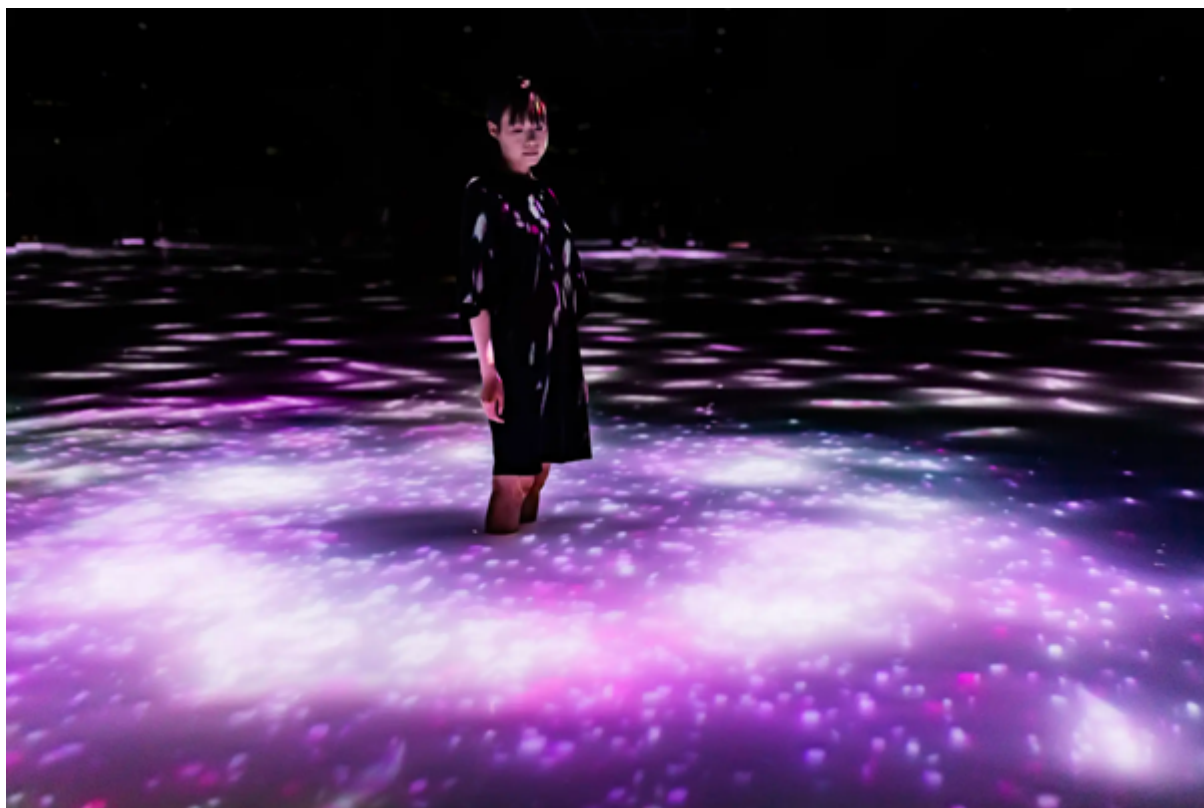
チームラボ 《 人と共に踊る鯉によって描かれる水面のドローイング 》 ©チームラボ