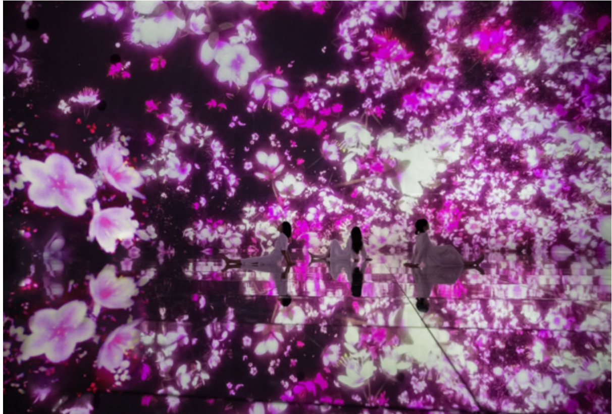
チームラボ 《Floating in the Falling Universe of Flowers》 ©チームラボ

チームラボプラネッツ（東京・豊洲）、3月から【桜】が満開。Google検索年間ランキングで「世界で最も人気のある美術館・博物館」トップ5に、訪日ラボ「インバウンド人気観光地ランキング」では日本一に