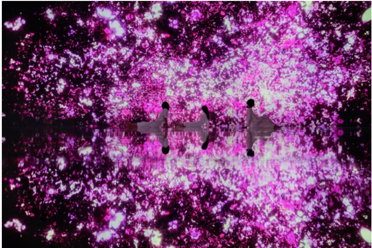
チームラボ 《 Floating in the Falling Universe of Flowers 》 ©チームラボ