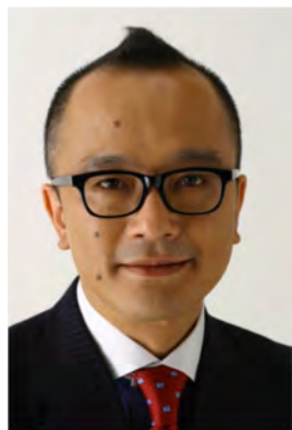
山田 五郎【やまだ・ごろう】編集者・評論家