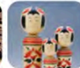
鳴子こけし(宮城県)