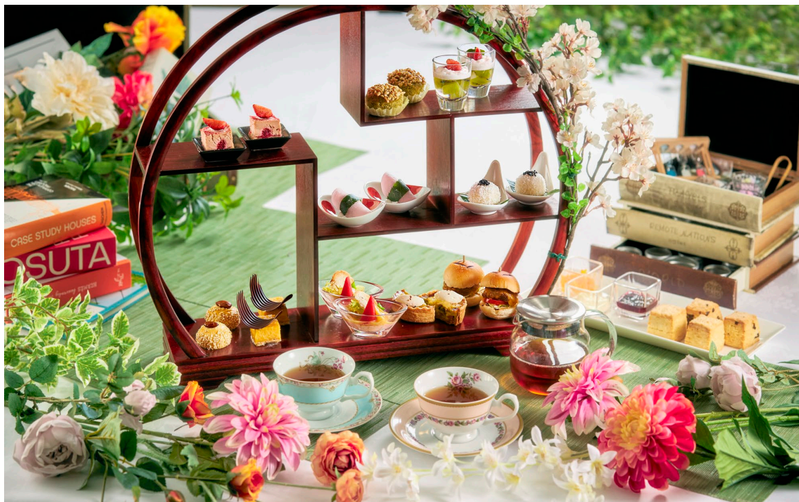
「至福のアフタヌーンティー」 5,500円（税込） 写真は2名分

芝パークホテルのレストラン「ザ ダイニング」は、2025年3月3日（月）から2025年5月25日（日）まで、至福のアフタヌーンティーを開催いたします。和洋中、3つの異なるテイストが楽しめるこの特別なメニューには、デザートとセイボリーがバランスよく取り揃えられています。例えば、イチゴとフランボワーズのムースやミニハンバーガー、北京風パイナップルクッキー、桜餅など、バラエティ豊かな美食があなたを待っています。また、16種類のドリンクが用意されており、茶葉の交換も自由です。ホテル館内には約1,500冊の本があり、ゲストはお好きな本を選んで閲覧することも可能です。芝パークホテルで至福のひとときをお過ごしください。