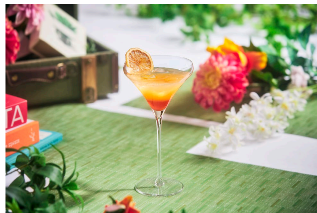
おすすめの期間限定カクテル「晴 ～はる～」1,400 円 (税込・サ別)