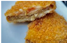
<浅草 もんじゃころっけ> もんじゃころっけ プレーン