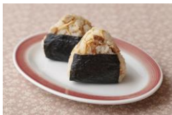
<八王子観光コンベンション協会> 八王子ラーメン風おにぎり