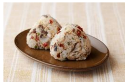
<三宅島観光協会> ごまサバとドライトマトの アヒージョおにぎり