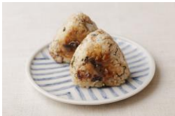
<昭島観光まちづくり協会> 拝島ねぎみそそぼろの 混ぜご飯おにぎり