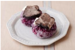
<こだいら観光まちづくり協会> こだいら産ブルーベリーと ローストポークのおにぎり