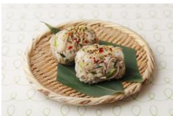
<新宿観光振興協会> 内藤とうがらし 七色そばおにぎり