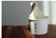
<和風ジェラートおかしTOKYO > ジェラート