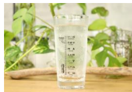
安心堂 沿線グラス