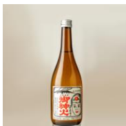
谷口酒造 御神火スタンダード