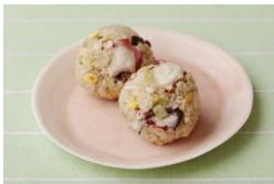
<大田観光協会> 海苔たこべったん風 おにぎり