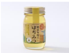
みつばちファーム 多摩のアカシアはちみつ