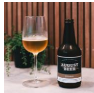
アウグスピール アウグスピルスナー