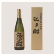
八丈島酒造 江戸酎（えどちゅう）25°