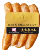
大多摩ハム TOKYO X桜燻あらびきウインナー