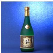
石川酒造 多満自慢純米大吟醸