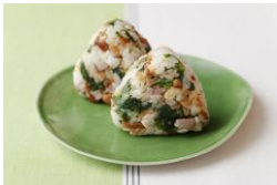
<神津島観光協会> 明日葉とナッツの オイルおにぎり