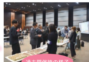
過去開催時の様子