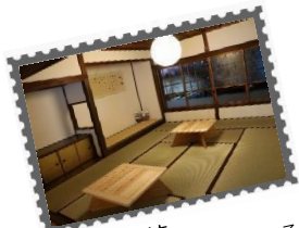
ごえん分校 クラウドファンディングによる 古民家再生プロジェクトで誕生。