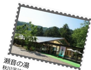
瀬音の湯 秋川溪谷にある眺望抜群の温泉施設。