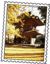
広徳寺 大銀杏で有名な紅葉の名所。